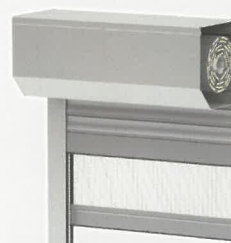
System Classic + Moskitiera