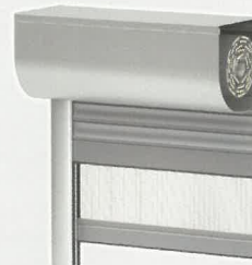
System Rondo + Moskitiera