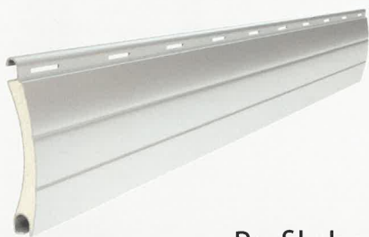
Profil aluminiowy - gięty

Profile aluminiowe tworzące pancerz rolety wypełnione są pianką poliuretanową, która zwiększa ochronę przed niekorzystnymi warunkami pogodowymi oraz hałasem. Wielowarstwowe lakierowanie proszkowe powierzchni zapewnia trwałość koloru pancerza. Profile występują w wielu odmianach, różniących się grubością, wysokością, sztywnością itp. co pozwala na precyzyjny dobór w zależności od koloru, powierzchni rolety czy poziomu ochrony.