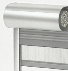
System Oval + Moskitiera