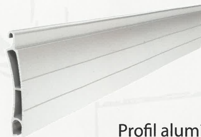
Profil aluminiowy - ekstrudowany